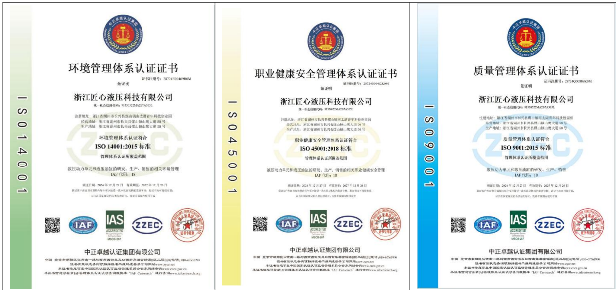
环境管理体系证书

公司顺利通过了并获得 ISO9001 质量管理体系认证、ISO14001 环境管理体系认证、ISO45001 职业健康安全管理体系认证。并准备开展“浙江制造”品牌认证，公司将严格按国际质量管理体系执行，使企业产品的质量得到有力的保障，从而使企业“追求完美，精益求精，敢于世界一流水平争锋”的质量方针得以顺利推行。自建厂以来，公司从未出现过重大质量投诉，在历年接受各级质量生产部门的抽检中，合格率均达 100%。